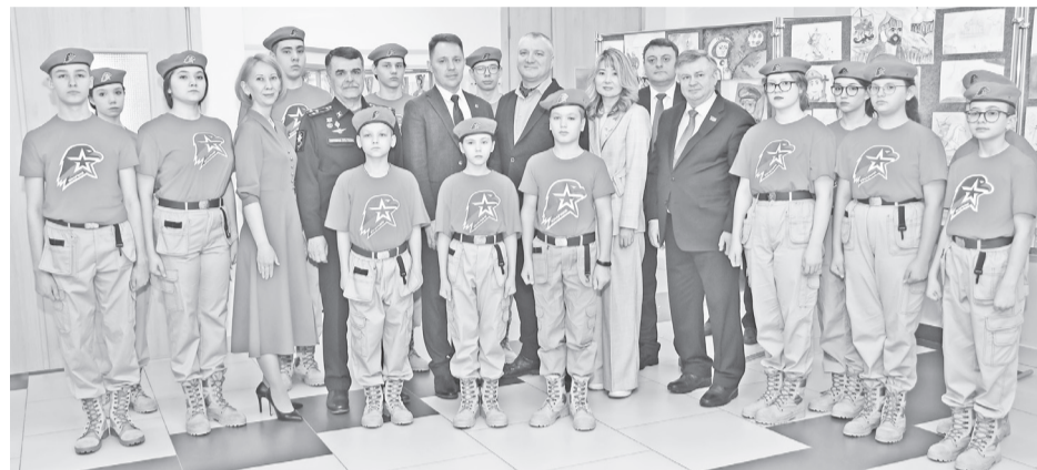
Тепло принимали Героев России в городском лицее. Выступление для гостей подготовили участники проекта «ЮНАРМИЯ».

– На протяжении 27 лет я регулярно встречаюсь с молодёжью и рассказываю эту историю. Но всё равно, когда смотрю