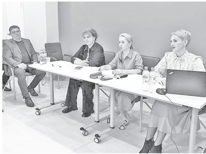
В структуре инвестсовета города в этом году произошли изменения.

В постоянный состав входят 11 человек из числа представителей администрации города, его руководителем будет глава Губкинского Андрей Бандурко. Временный состав, а это ещё 11 человек, будут избирать каждые два года из числа предпринимателей города. В ходе встречи был избран временный состав.