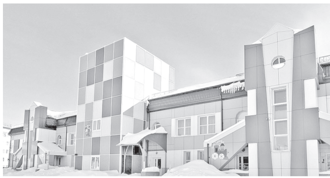
Этим летом на территории детского сада «Светлячок» появится 100-метровая беговая дорожка.

Капитальный ремонт ожидает детский сад «Светлячок». Здесь обустроят детскую площадку для активных игр и 100-метровую беговую дорожку с прорезиненным покрытием. На прилегающей территории покроют свежей краской бордюры, вазоны, пожарные лестницы и люки. В самом здании отремонтируют внутренние помещения,