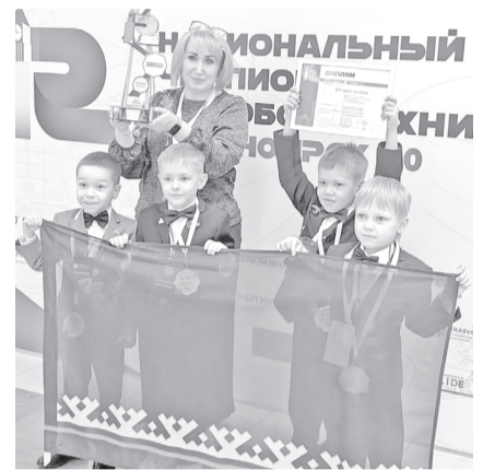
Команда STT.team (middle) – воспитанники станции технического творчества.

Участниками Национального чемпионата по робототехнике «Красноярск 5.0» стали три губкинские команды. В этом году он собрал более 3000 участников из 52 регионов России, а также из дружественных государств.