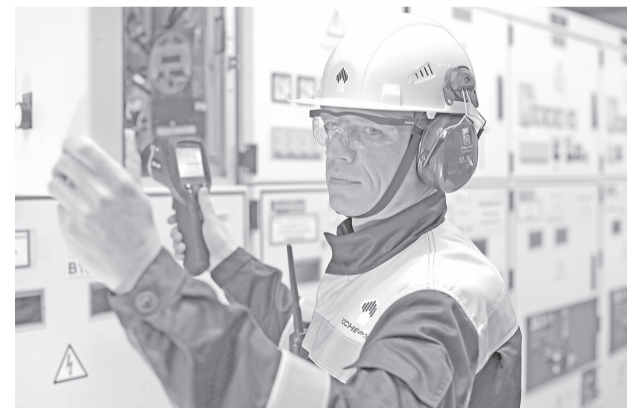
Электростанция на Тарасовском месторождении.

В Компании действуют программы по улучшению условий труда и быта на производстве, оздоровлению и отдыху персонала, развитию физической культуры и спорта сотрудников и членов их семей, программы по улучшению жилищных условий, предоставлению образовательных займов, негосударственного пенсионного обеспечения. «Роснефть» уделяет особое внимание