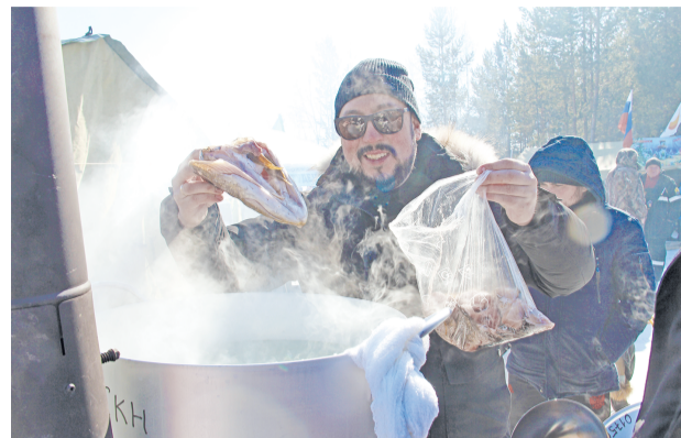
На фестивале приготовили 12 видов ухи, попробовать её могли все желающие.

Члены жюри тщательно оценивали вкусовые качества, казалась бы, нехитрого рыбацкого блюда. Особый восторг у дегустаторов вызвали оформление и оригинальная подача блюд. Судей пригласили посетить и советский общепит, и мишленовский ресторан, и резиденцию морского царя.