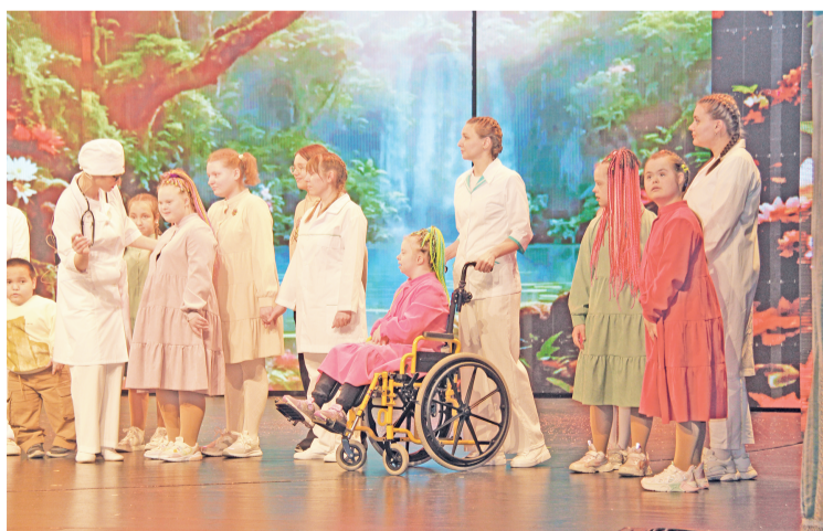
Герои спектакля «Крик из темноты» – участники проекта «Инклюзивная театральная лаборатория «В ритме»».