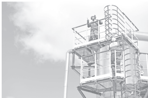
Дожимная компрессорная станция Комсомольского месторождения.

С 1986 года, с начала основания, предприятие является основным налогоплательщиком и работодателем Губкинского. В прошлом году за летний период в «РН-Пурнефтегаз» трудоустроено 18 несовершеннолетних граждан. Многие из подростков после работы в Компании приняли решение поступать в нефтяные колледжи и вузы. В настоящее время на предприятии трудятся 10 инвалидов, этой категории граждан уделяется особое внимание.