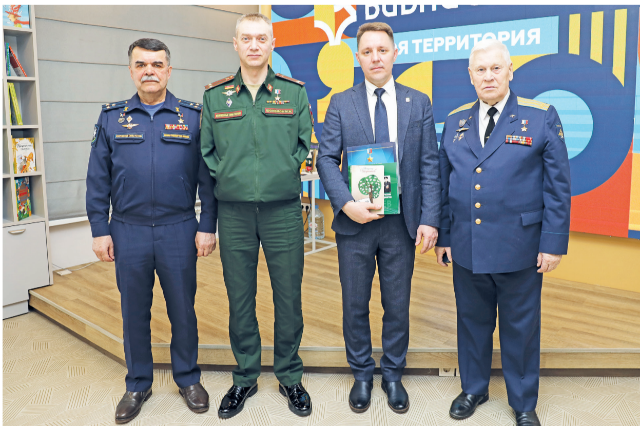
Почётными гостями патриотического форума «Герои: от Руси до России», который прошёл в Губкинском 5–6 апреля, стали сразу три Героя России: лётчики Анатолий Копыркин и Владимир Шарпатов , участник СВО Максим Шоломов .

– Нам поставили задачу – занять определённый перекрёсток, мы удерживали его в течение семи суток.