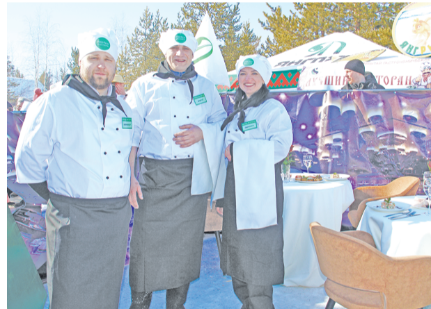
Одну из презентаций готового блюда провели в духе мишленовского ресторана.

Победителем фестиваля стала команда управления образования города «Клёвое место», второе место заняла команда «Настроение рыбацОК» компании «Белоруснефть-Сибирь», третье – сборная администрации города «Дружба народов». Также в завершение фестиваля был проведён розыгрыш более чем 30 призов от спонсоров мероприятия.