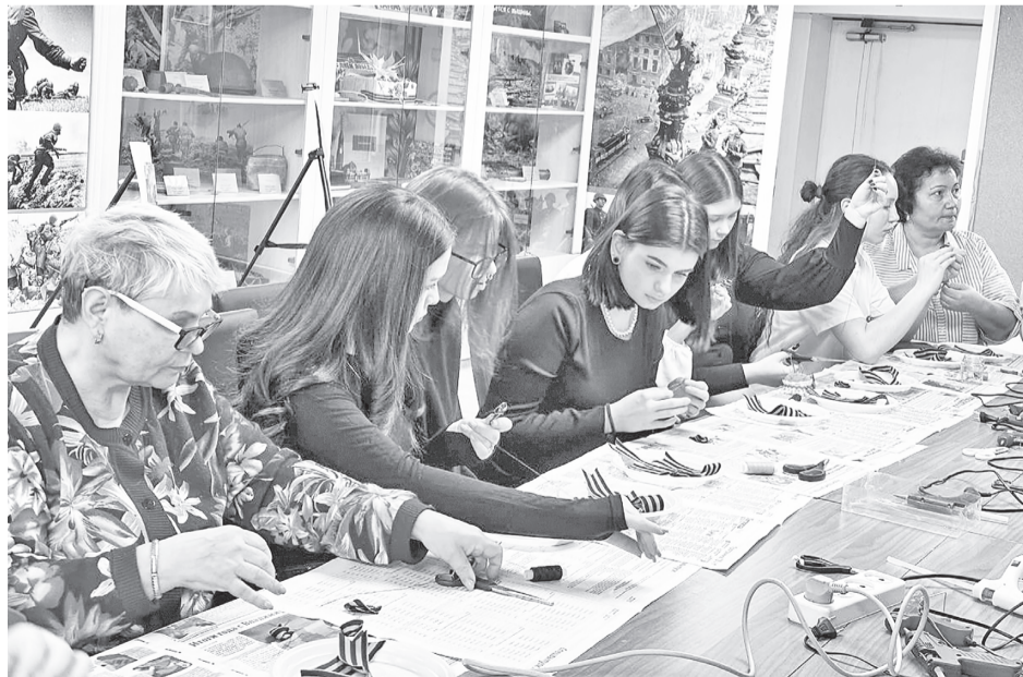
Творческая деятельность объединила разные поколения участников мероприятия.

Добавим, что общественная организация «Ветеран», как и многие другие учреждения и предприятия Губкинского, активно участвует в подготовке и отправке гуманитарной помощи в подшефный Волновахский район. Тематические недели в округе проводятся в рамках стратегии развития региона «Ямал-100».