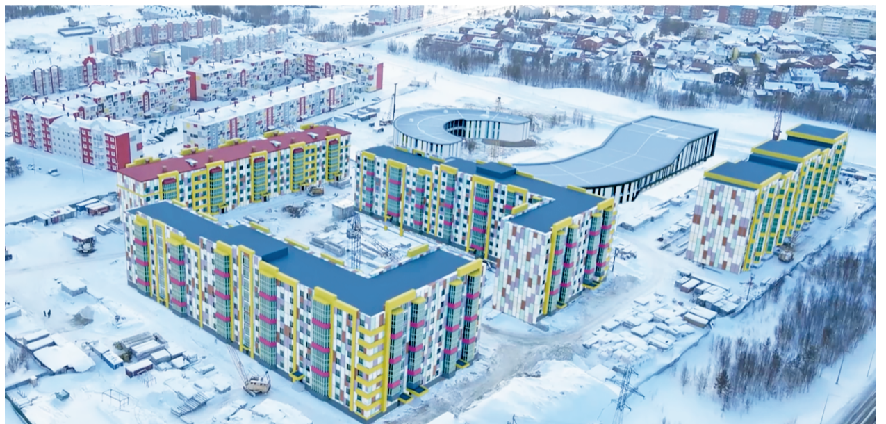
В 17-м микрорайоне будет создана современная инфраструктура для комфортного проживания губкинцев. | Дизайн-проект: администрация Губкинского.

Уже несколько лет подряд в развитии города используется комплексный подход. Он полностью оправдал себя как наиболее эффективный. В прошлом году был составлен