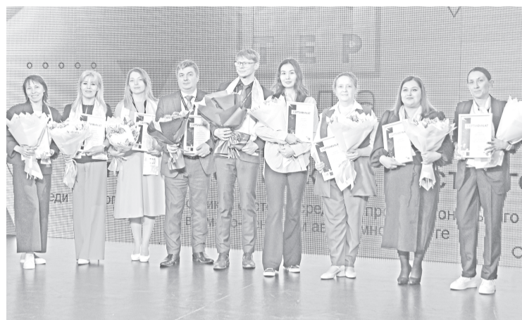
Участники конкурса «Мастер года» на церемонии награждения.

Масштабное мероприятие завершилось на символической