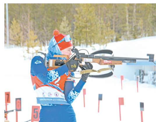
📷 В биатлоне важна не только скорость, но и меткость.

Главным судьёй первенства выступила мастер спорта международного класса двукратная чемпионка Европейских юношеских Олимпийских игр, чемпионка мира и Европы по биатлону прези-