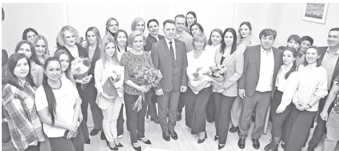
Коллектив Губкинской телерадиокомпании «Вектор».

Добавим, что СМИ работают в каждом муниципалитете округа. Новости о жизни региона выходят на телевидении, радио, в газетах и журналах, интернет-публиках и на сайтах СМИ. В редакциях трудятся более 230 корреспондентов, порядка 100 операторов, около 30 фотографов.