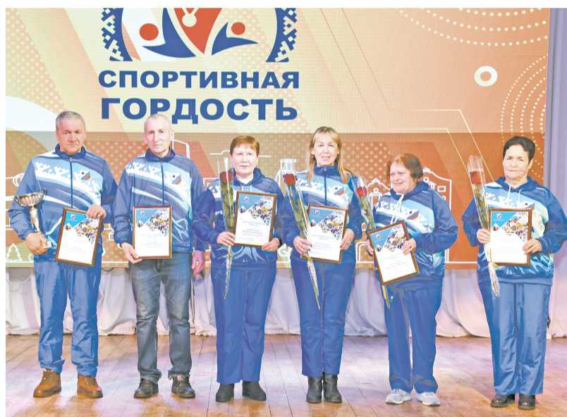
📷 Победители Спартакиады пенсионеров ЯНАО 2023 года.