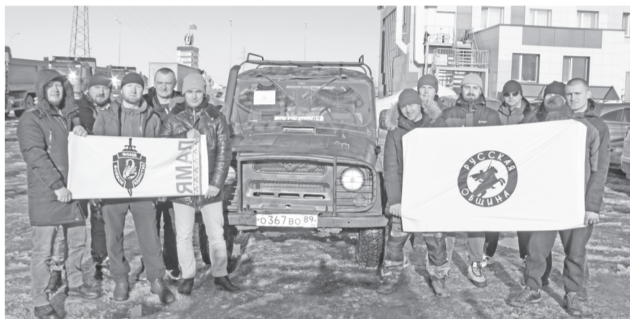
Фонд «Боевое единство», Союз пограничников и жители Губкинского подготовили для бойцов СВО автомобили повышенной проходимости.