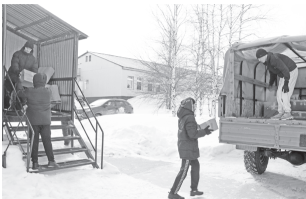
Губкинские студенты помогают с погрузкой гуманитарной помощи для жителей Волновахи.

Сегодня на Ямале действует более 50 мер поддержки для участников спецоперации и их семей. В нашем городе ими воспользовались почти 700 раз. Губкинские военнослужащие и члены их семей, кроме того, освобождены от уплаты налогов на имущество и землю.