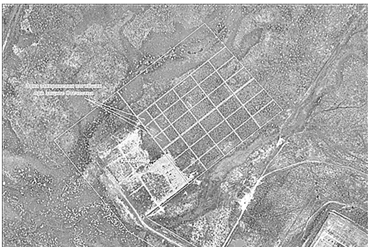
Схема размещения специализированных участков для воинских захоронений на кладбище, расположенном на земельном участке с кадастровым номером 89:05:030301:6824

Приложение № 1 к постановлению Администрации города Губкинского от «19» февраля 2024 года №340